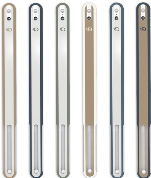
Cappuccino Anthracite Argile Neige Horizon Réglisse