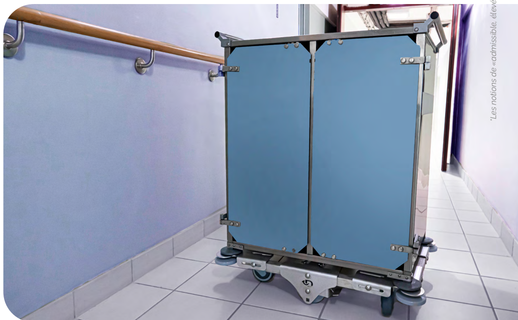
Groom® monté sur un chariot de petit-déjeuner

> Plus d'informations sur nos solutions : domalys.com